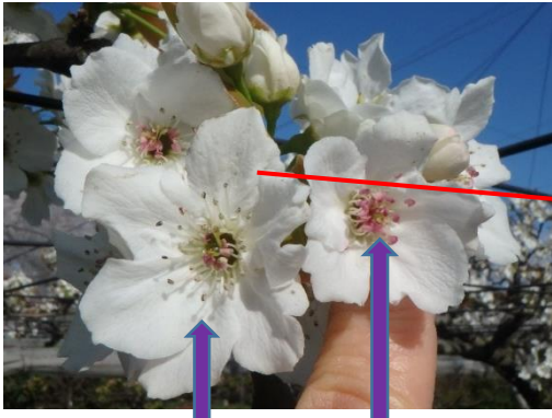
葯が開いている （花粉が出ている） 葯が開いていない （花粉が出ていない）

摘み取った花を利用する受粉方法（花の数と結実数を減らす効果あり）を紹介します。 生産農家では、主に受粉器による受粉、溶液受粉法が行われています。