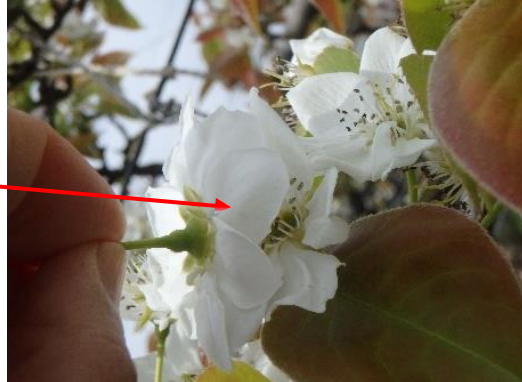
左の葯の開いた花を取り、受粉させる。