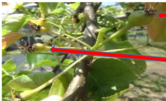
受粉がうまくいった果実 （そのまま大きくなる）