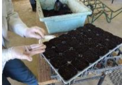
②種子をポリポットの上に置く。