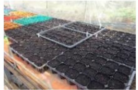
③指で種子を1cm程度押す。④土を平らにし、種子に土に埋める。⑤温床マットの上に置き、温かい場所で管理します。