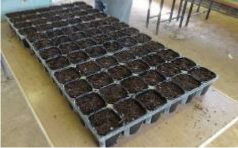
①腐葉土（落ち葉を腐らせた土）をポリポットに入れる。